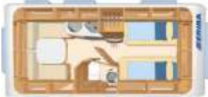
Nova Light 470