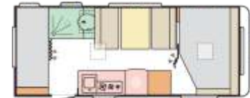
Altea 542 PK