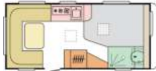
Altea 472 PU